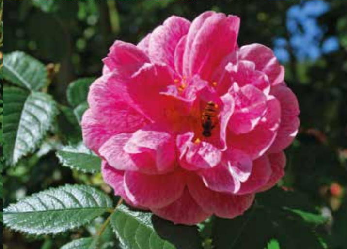
'Camelot' med svirreflue